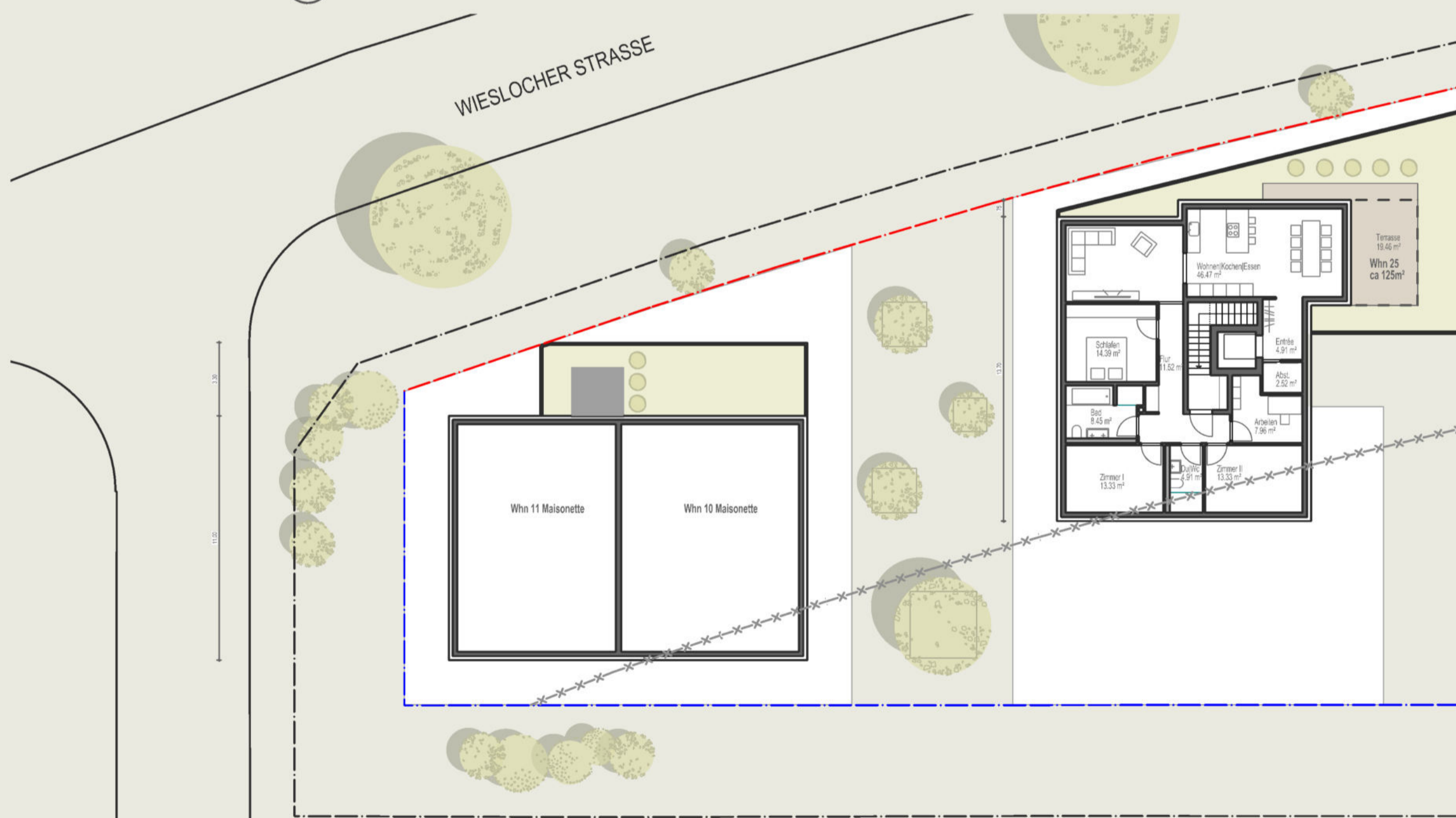
2. DACHGESCHOSS 1:200

BGF: Haus links: 217 m 2 Haus rechts: 240 m 2