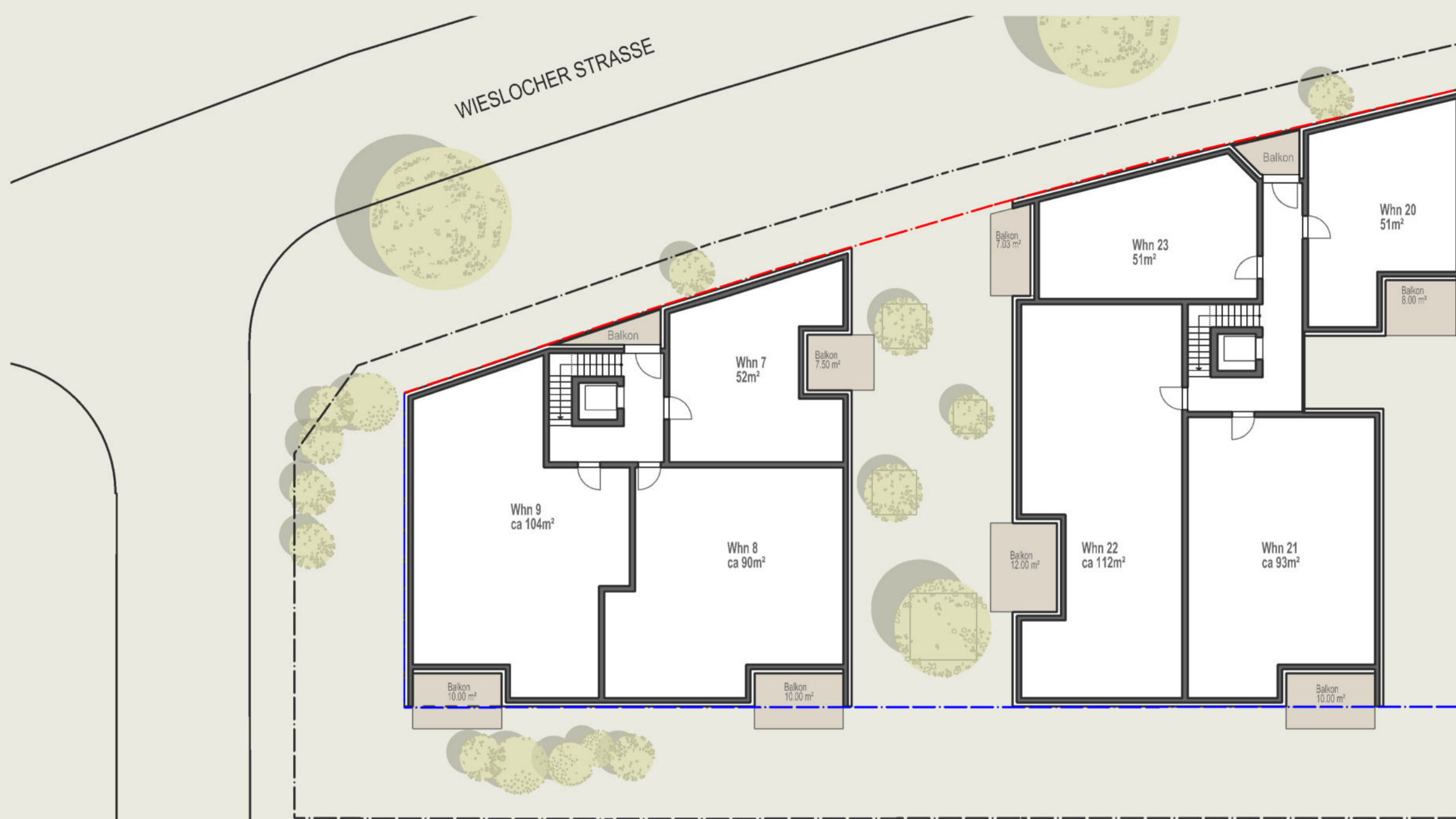
2. OBERGESCHOSS 1:200